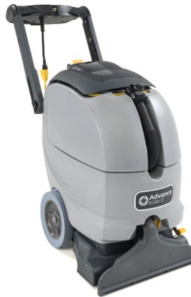
La imagen mostrada puede que no represente el modelo presupuestado

Una de las características ventajosas es que tiene la manguera de drenaje en la parte delantera, lo que hace que el vaciado del depósito sea mucho más simple, y el cabezal del cepillo consigue un mayor contacto con la moqueta, lo que mejora la aspiración, dejando la moqueta totalmente seca después de su limpieza. Por último, se trata de una máquina con un diseño compacto que hace que el almacenamiento y mantenimiento de ésta sea mucho más fácil.