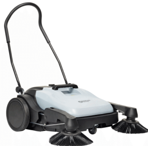
La imagen mostrada puede que no represente el modelo presupuestado

aparcamientos, centros comerciales, escuelas, talleres, estaciones de autobús/ferrocarril, así como en el exterior de edificios de oficinas.